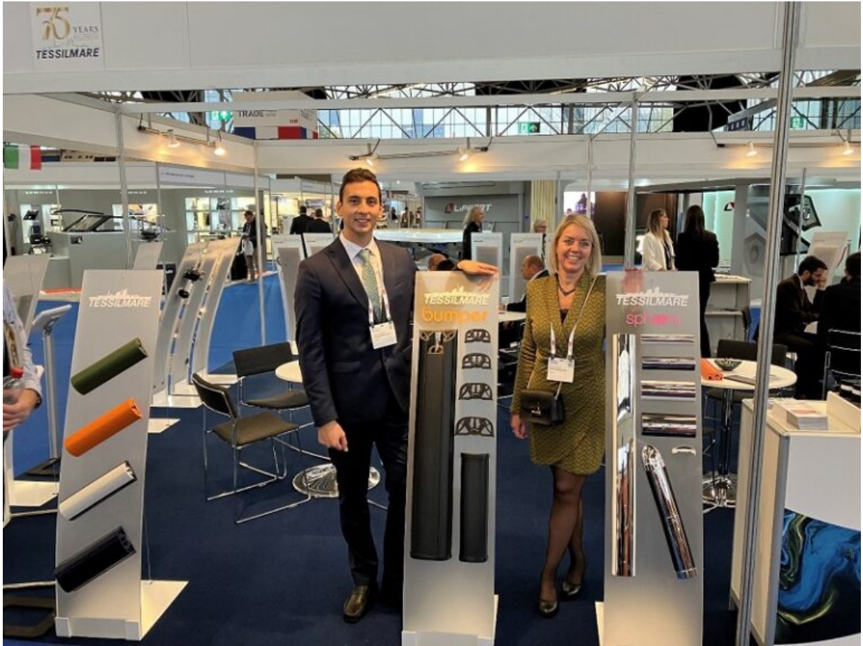
Team Tecnico/Commerciale Tessimare