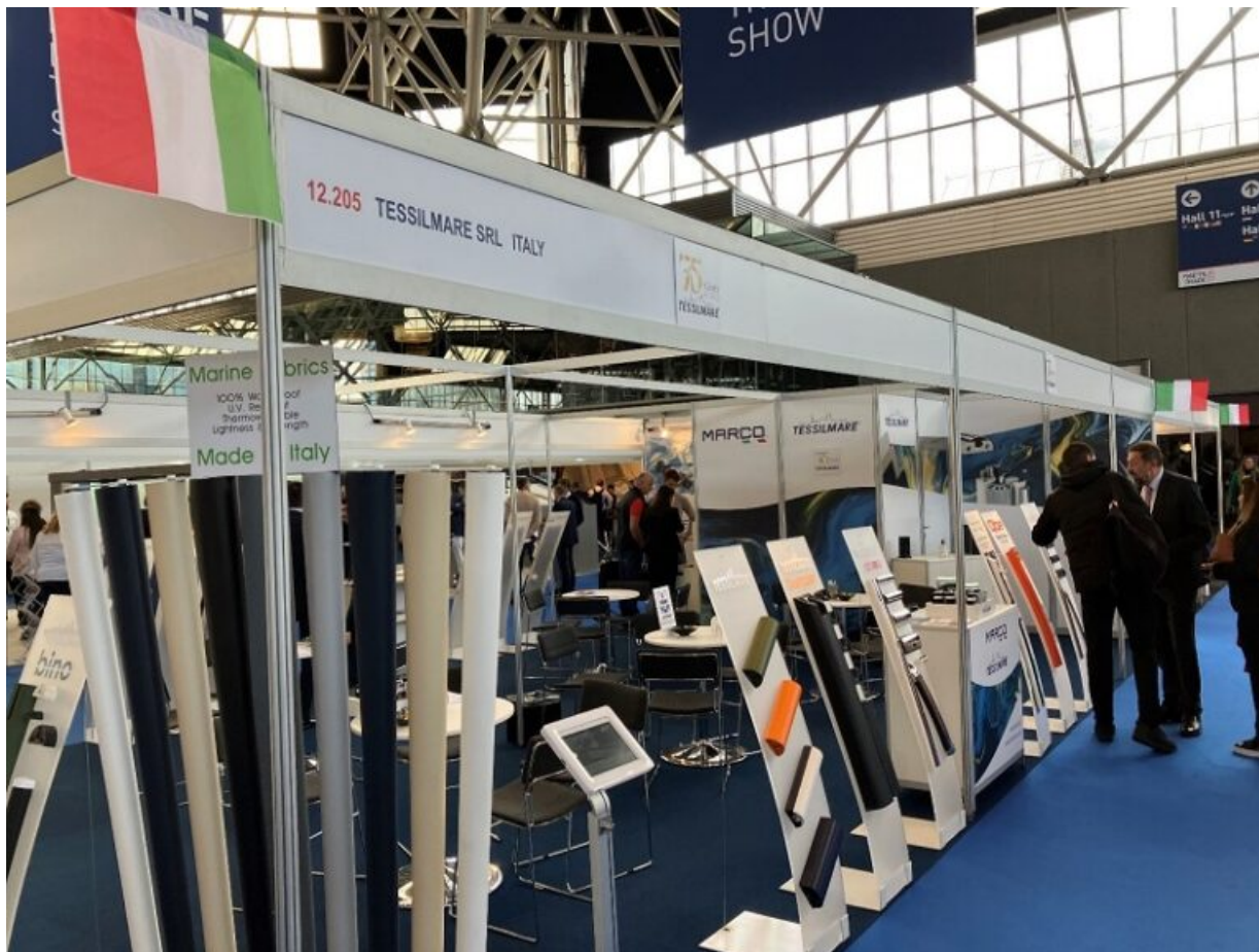
Tessilmare in fiera METS di Amsterdam

Il Dubai International Boat Show (DIBS) si afferma come l'evento numero uno della regione MENA nel settore del lusso marino e si terrà nel nuovo porto di Dubai, dove si potrà ammirare un'incredibile flotta di yacht e navi da diporto tra le più belle e più grandi del mondo.