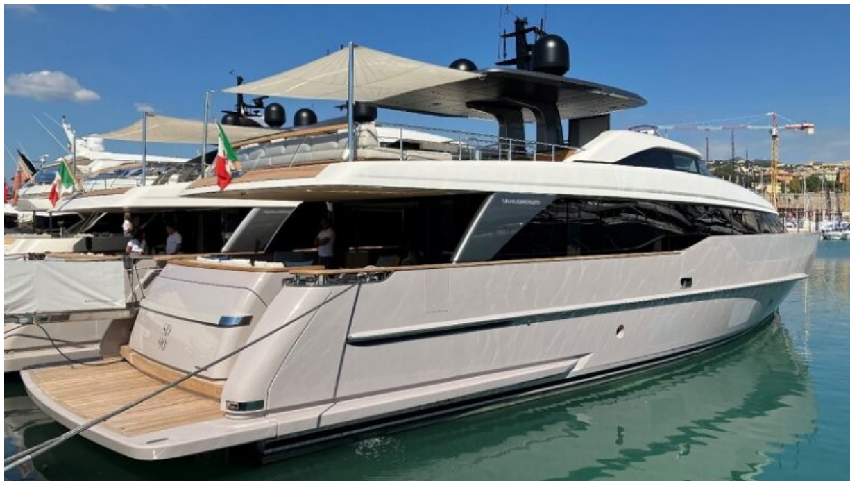
BINOX su Sanlorenzo

SPHAERA negli anni è diventato sempre di più il prodotto di punta di Tessilmare. Grazie alle sue altissime capacità tecniche non ha rivali.